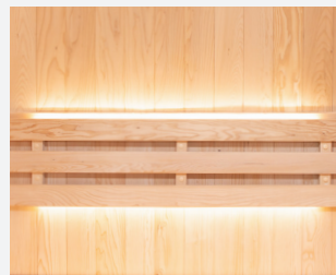
Bandeaux LED discrets