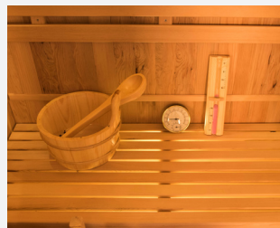
Kit sauna inclus