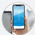
Conexión WiFi para control remoto