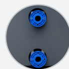
Accesorios de gran diámetro para estanques profesionales