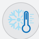
Amplio rango de funcionamiento hasta -15°C