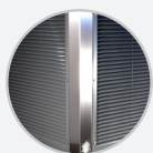
Estructura de acero inoxidable resistente a la corrosión