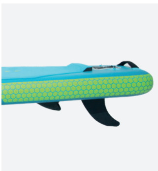
Prise de vitesse : aileron central pour une accélération rapide

Sa largeur généreuse et son long nose affilé lui confèrent des excellentes performances de glisse, en plus de sa rigidité et stabilité toutes deux inégalées. Son revêtement en EVA de qualité supérieure est un élément indispensable pour avoir des bons appuis lors des manœuvres et dans les vagues.