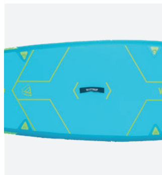
Utilisation 2 en 1 : fixation et fauteuil kayak inclus