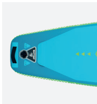
Tapis EVA ultra confort avec kick pad sur le tail