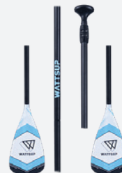
Pagaie 4 sections aluminium