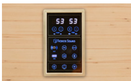
Panneau de contrôle digital dernière génération