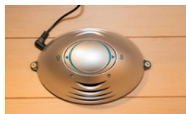
Purification de la cabine par ioniseur