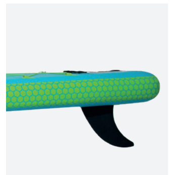
Ultra stable : aileron central amovible et largeur confortable