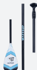
Pagaie 3 sections aluminium x2