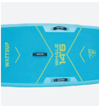
Un vrai SUP familiale : x8 D-rings pour 2 sièges kayak

Il est idéal pour les débutants grâce à une stabilité et un confort optimal, pouvant supporter jusqu'à 210 kg. Le tapis EVA permet une meilleure adhérence et le kick pad facilite les manœuvres. Ce paddle est conçu pour des sorties en mer ou sur lac en toute confiance, offrant une excellente performance et durabilité pour plusieurs années.