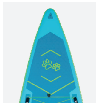
Pet-friendly: tapis EVA qui accueillera votre compagnon à 4 pattes sans risque de glisse