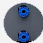
Accesorios de gran diámetro para estanques profesionales