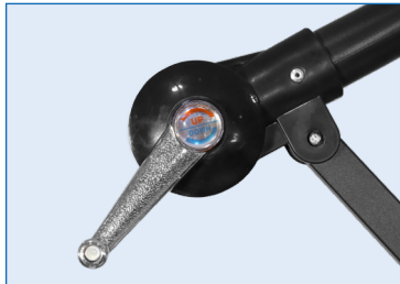
Polea de manipulación