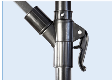
Palanca de despliegue