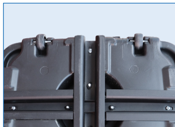
Ruedas de transporte