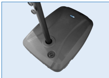
Pie de acero + lastre