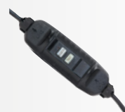
Toma eléctrica de 5m con protección diferencial de 10 mA

Embalaje multilingüe con estructura reforzada que incluye todos los accesorios