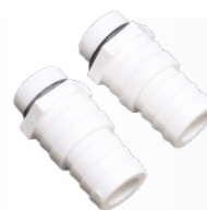
Conectores de PVC Ø 32- 38mm