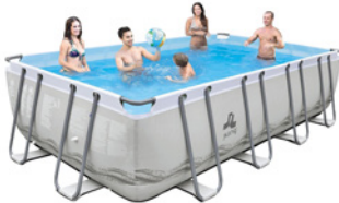
Piscina sobre suelo