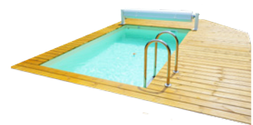
Piscina enterrada <35m 3