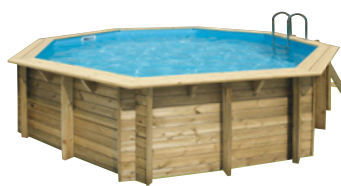
Piscina de madera