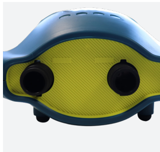
Inflate / Deflate : rapide et sans effort