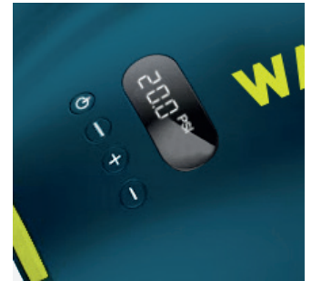
Affichage digital : meilleure compréhension