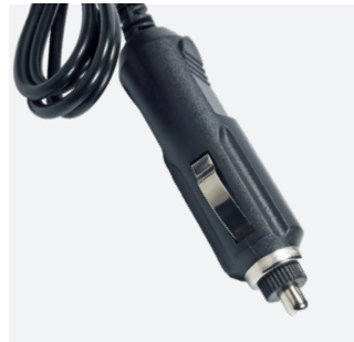
Connecteur voiture 12V : compatibilité universelle