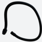
TUYAU D'AIR 1m