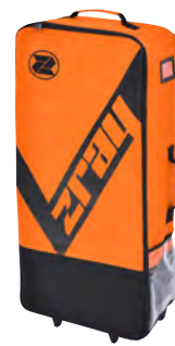
Sac de transport Premium