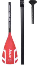
Pagaie Elite aluminium